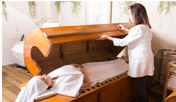
ラドン・ハーバルバス

薬草の香りで、心と身体を癒します。 自律神経が整えられ、質の良い眠りに就けます。